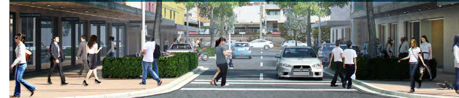
Hình minh họa của Khu vực Granville. Hình ảnh chỉ có tính cách biểu thị. Có thể thấy đối.

Sau ba năm cộng tác và hội ý với các hội đồng thành phố và cộng đồng dọc theo Vành đai Parramatta Road, hiện nay chúng tôi đã có một Sách lược để hướng dẫn sự phát triển, thay đổi và đầu tư.